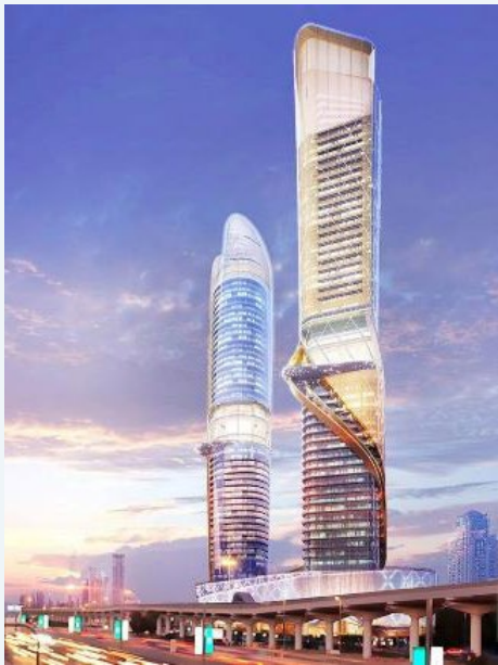
Rosemont 5-Star Hotel & Residence

Parmi les firmes canadiennes qui résident dans les Émirats, on peut citer : SNC Lavalin, NORR, ZAS Architects + Interiors, IBI Group, EllisDon, B+H Architects, gsmprjct, MHPM, Stantec, Forrec, Brookfield, WSP Parsons Brinckerhoff, Hatch et Zeidler.