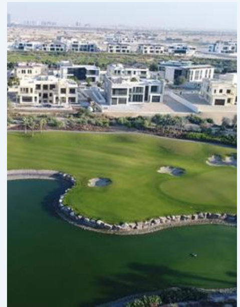
Dubai Hills Estates