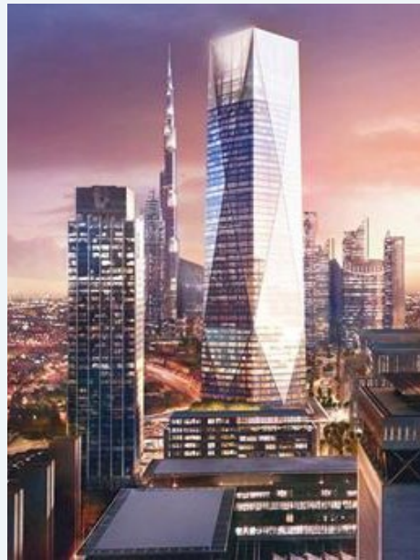
ICD Brookfield Place